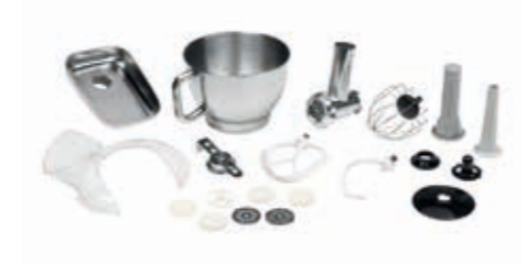
MD16480 Premium Stand Mixer Power 1000 Watt | For mixing, beating and blending | 8 speed settings | With additional pulse function | Swing head with safety lever | 4.6 L bowl | Locking mechanism for safe bowl assembly | Color in red or white