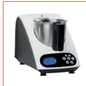
Der Alleskönner The All-rounder