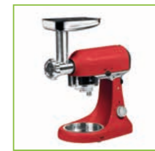
Fleischwolf-Funktion Meat grinder function